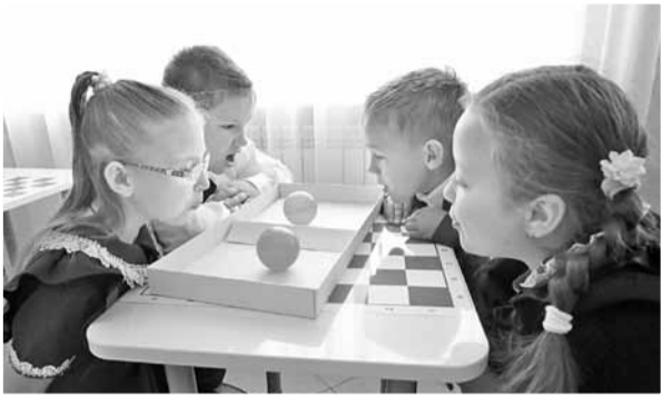
Дыхательная гимнастика на интерактивной переменке