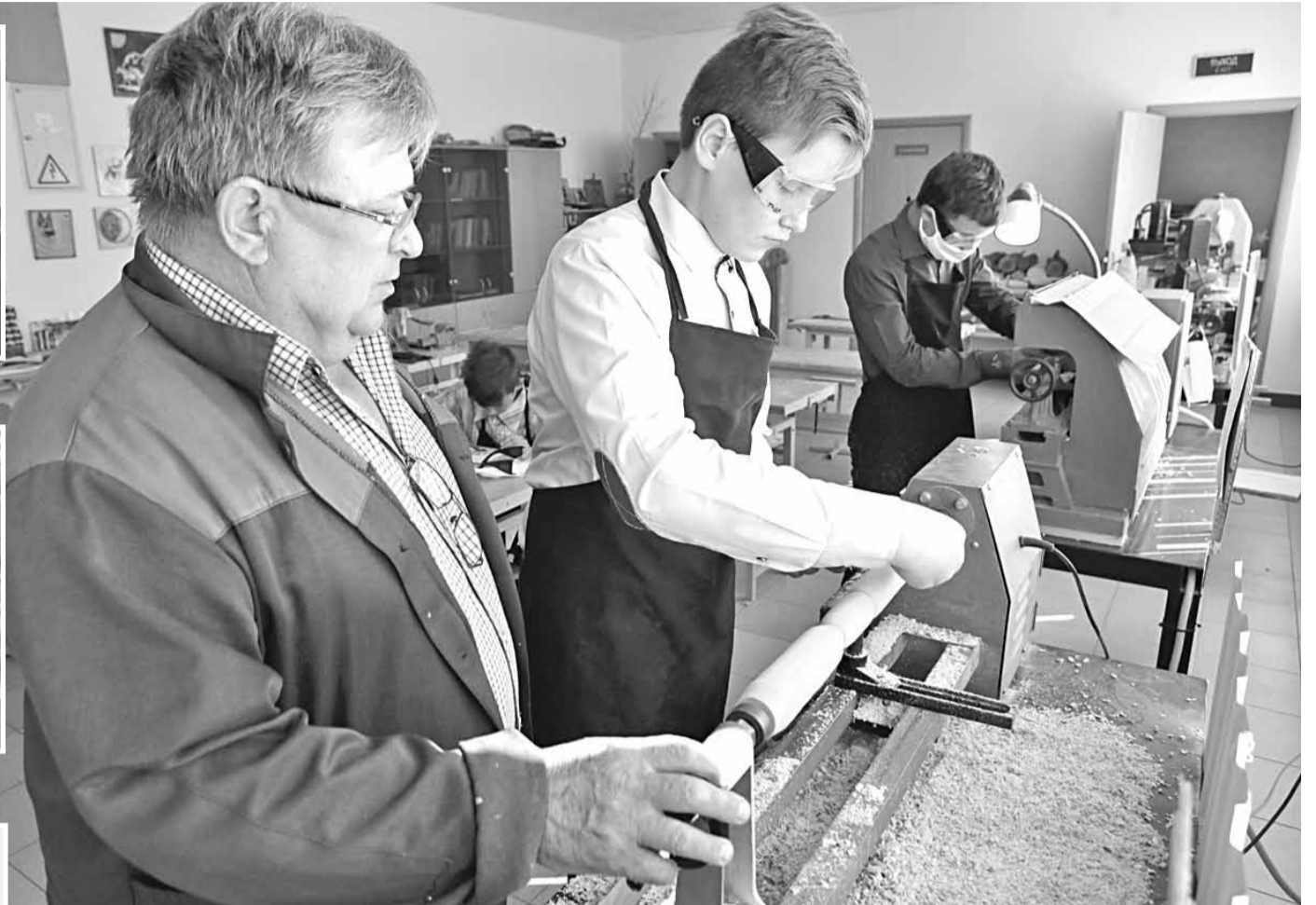
На уроке технологии в школьной мастерской