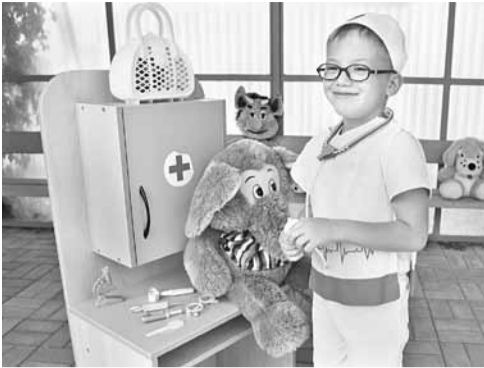
В «Ветклинике» дошколята печат плюшевых зверей