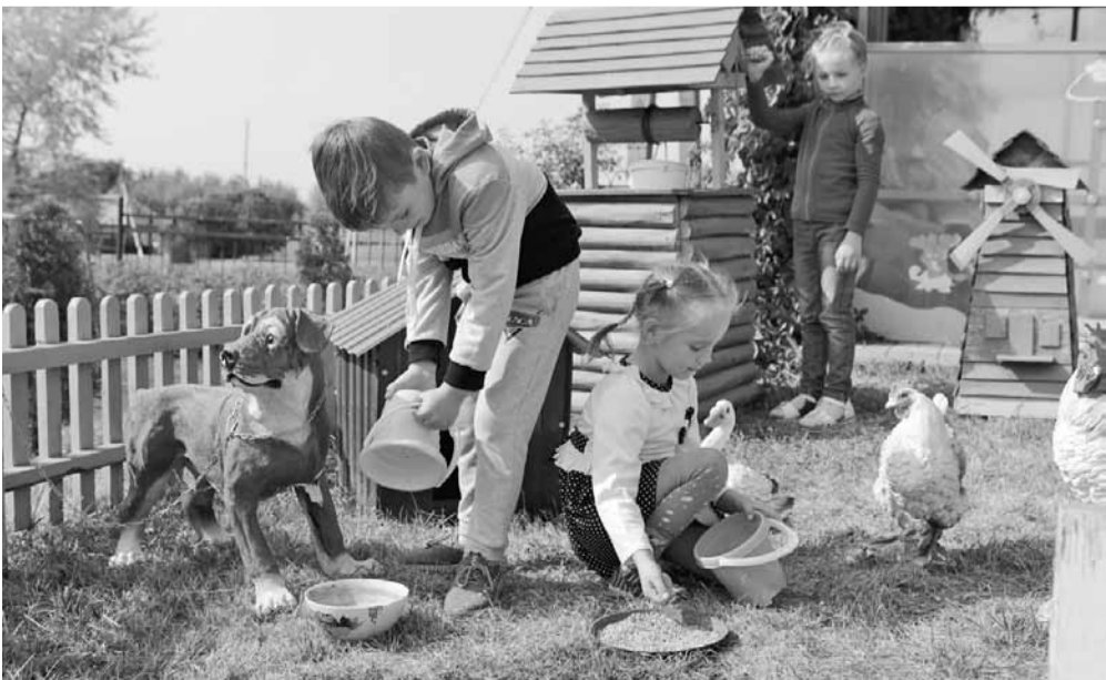
На «Фермерском дворике»

Ольга МУШТАЕВА » ТЕКСТ