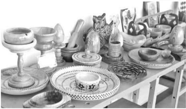
Изделия из дерева, сделанные школьниками на уроках технологии