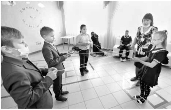
Четвероклассники играют в «Паутинку добра»