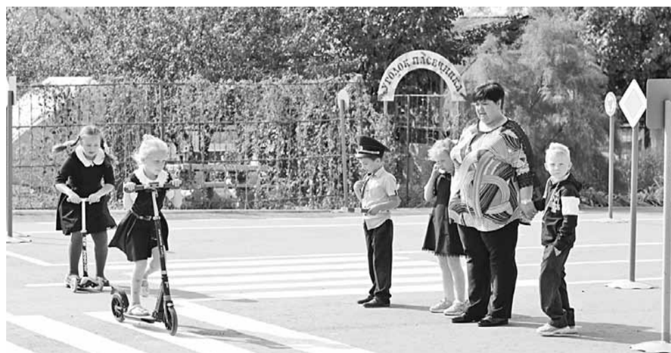
В «Автогородке» школьники на практике учат Правила дорожного движения

ЗА 45 ЛЕТ КЛИМЕНКОВСКАЯ ШКОЛА ВЫПУСТИЛА 575 УЧЕНИКОВ, 24 ИЗ НИХ НАГРАЖДЕНЫ ЗОЛОТЫМИ И СЕРЕБРЯНЫМИ МЕДАЛЯМИ, 30 СТАЛИ ПЕДАГОГАМИ (12 ИЗ НИХ ВЕРНУЛИСЬ ПРЕПОДАВАТЬ В РОДНУЮ ШКОЛУ).