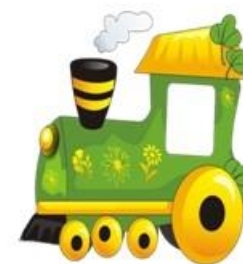
Поезд, Машинист, Вагоны

3. Они бывают разные – Зеленые и красные. Они по рельсам вдаль бегут, Везде встречают их и ждут.