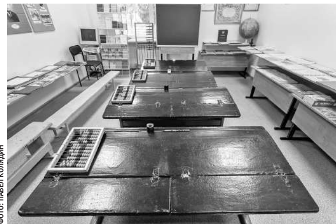
Зал истории образования в музее Томаровской школы № 1

С тех пор все уроки русского языка, литературы и беседы о советском обществе проходили без курьёзов. Молоденькая учительница даже съездила в областное управление кинофикации. Договорилась каждую неделю по пятницам привозить в колонию фильмы.