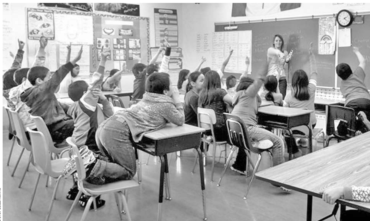
Занятия в одной из канадских школ